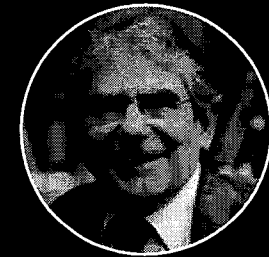
Carlos Ayres Britto Ex-Ministro do Supremo Tribunal Federal e advogado