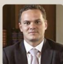
Ticiano Figueiredo Presidente do Instituto de Garantias Penais